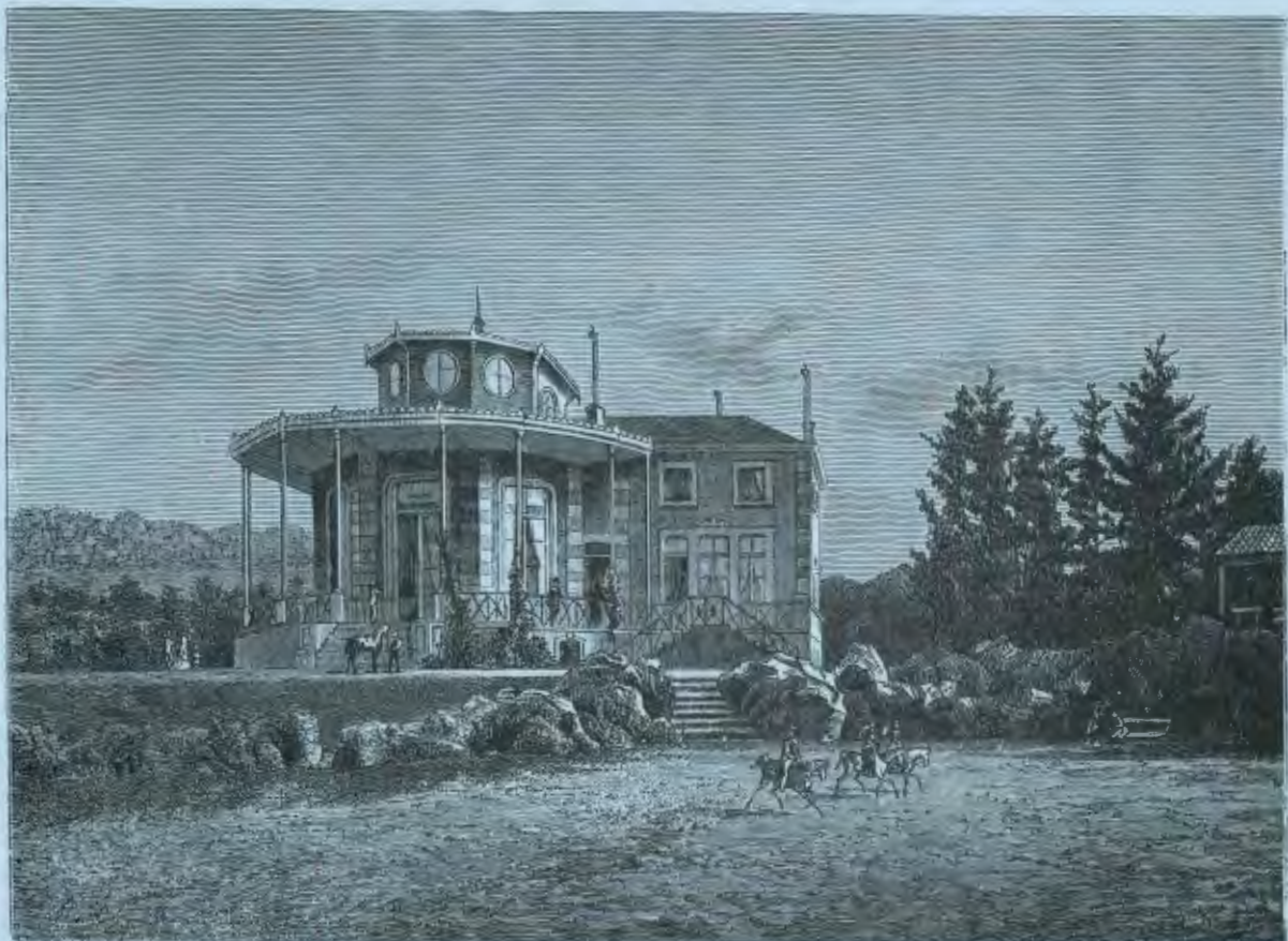
La Fontaine de Barisart à Spa vers 1885