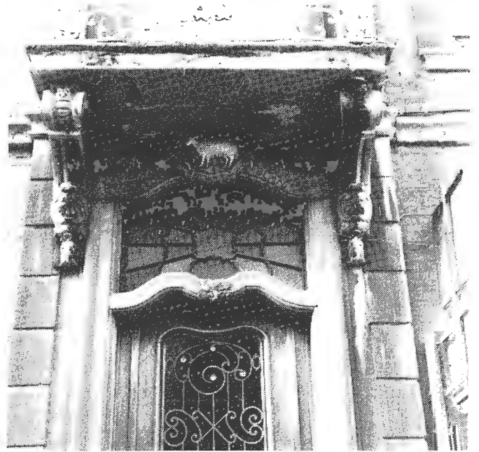
Maison Bifer à Spa