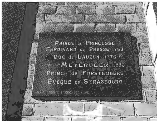
Plaque apposée sur la maison Bifer