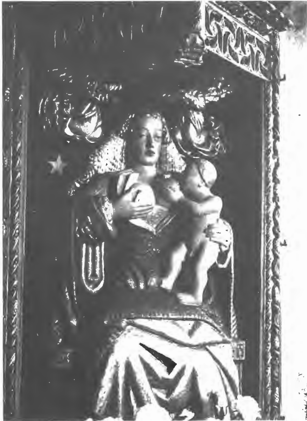
3. Etonnante statue polychrome de la Vierge, surnommée « La Mère-au-lait », les seins gonflés, elle allaite l'Enfant-Jésus. Chapelle de Notre Dame de Tréguron près de Gouézec (Finistère). Représentation chrétienne d'une déesse païenne de la fécondité ? juin 1983.