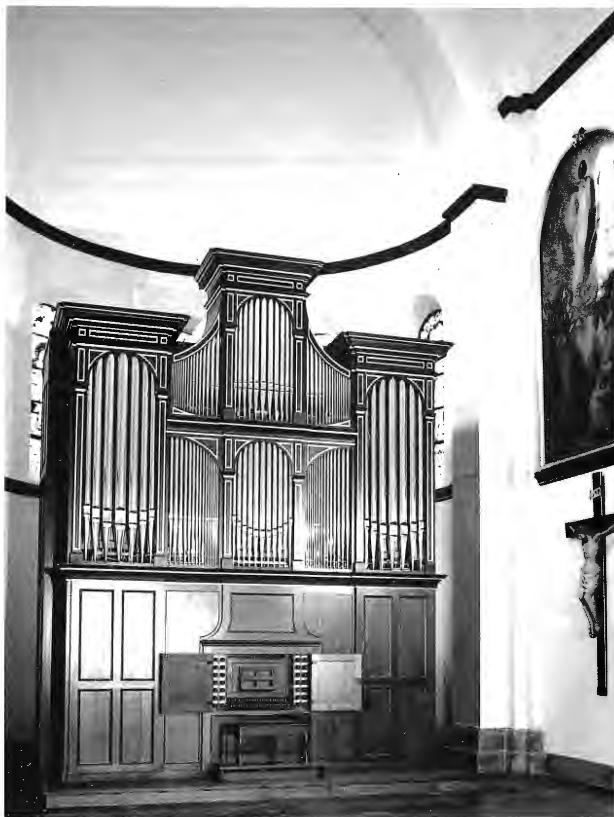
Le nouvel orgue de Spa, cliché extrait de «Le nouvel orgue de l'église N.-D. et St-Remacle à Spa» publié par les Amis de la Musique, Spa, 1993.