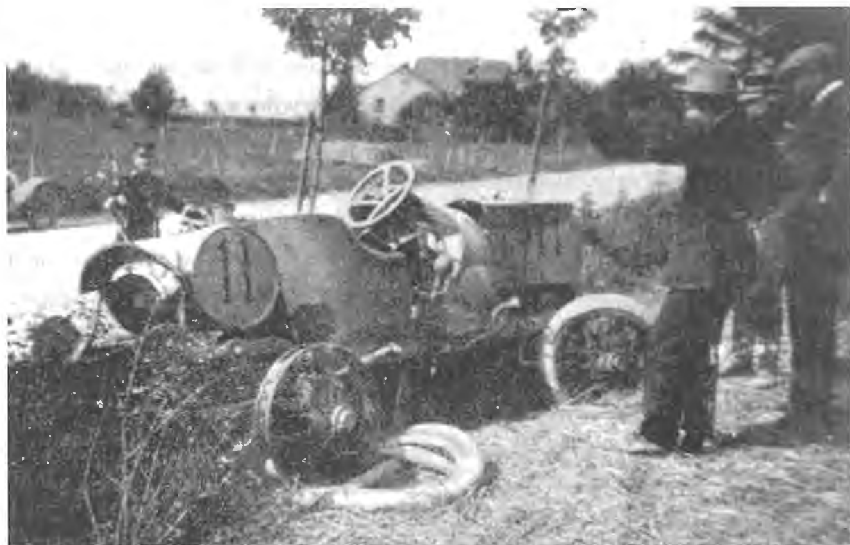
Voiture du baron de WOELMONT.