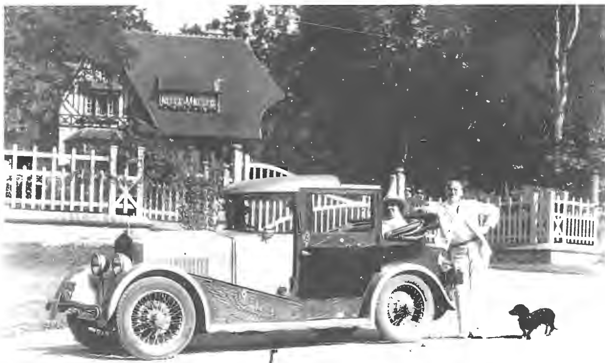
Voiture FN Type Sport devant la Villa «Les Oriniels».