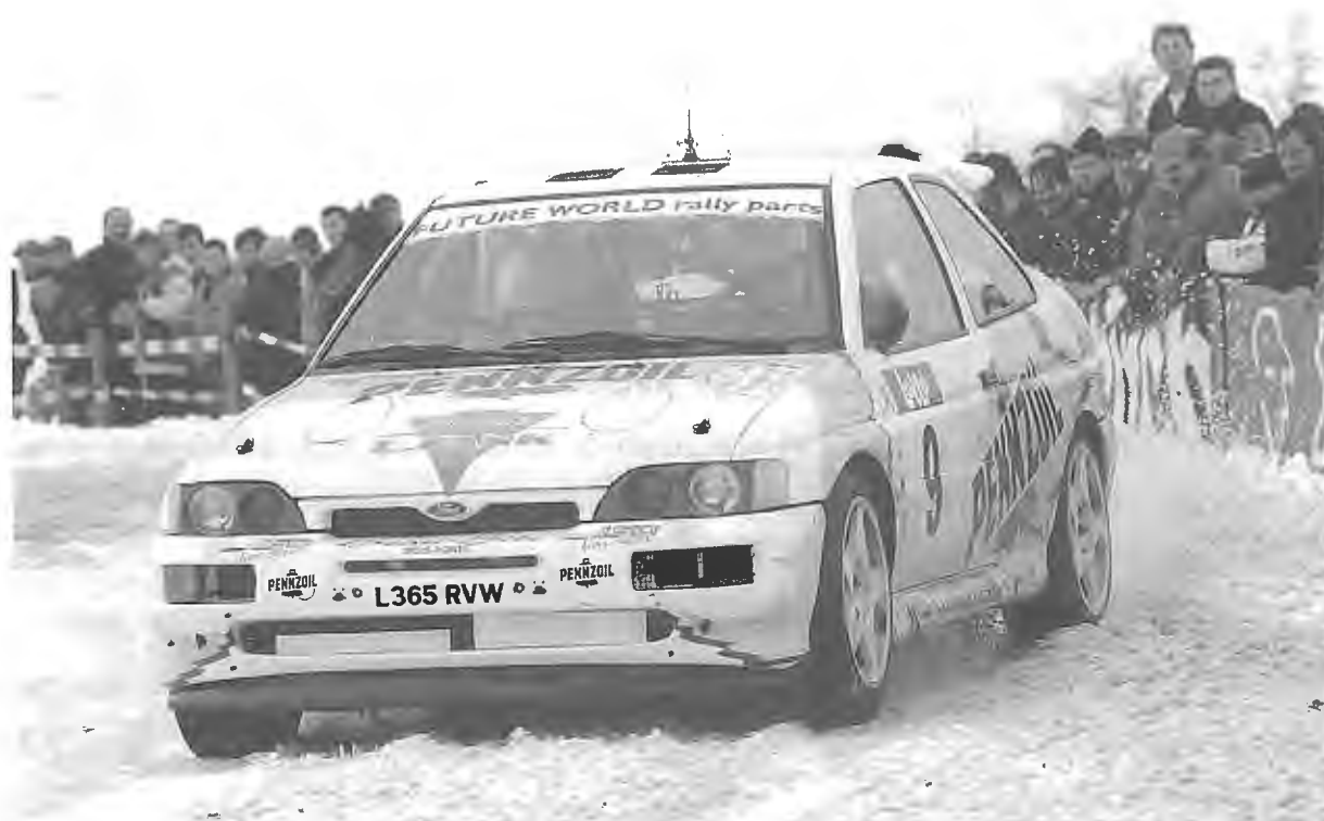
Boucles de Spa 1996.