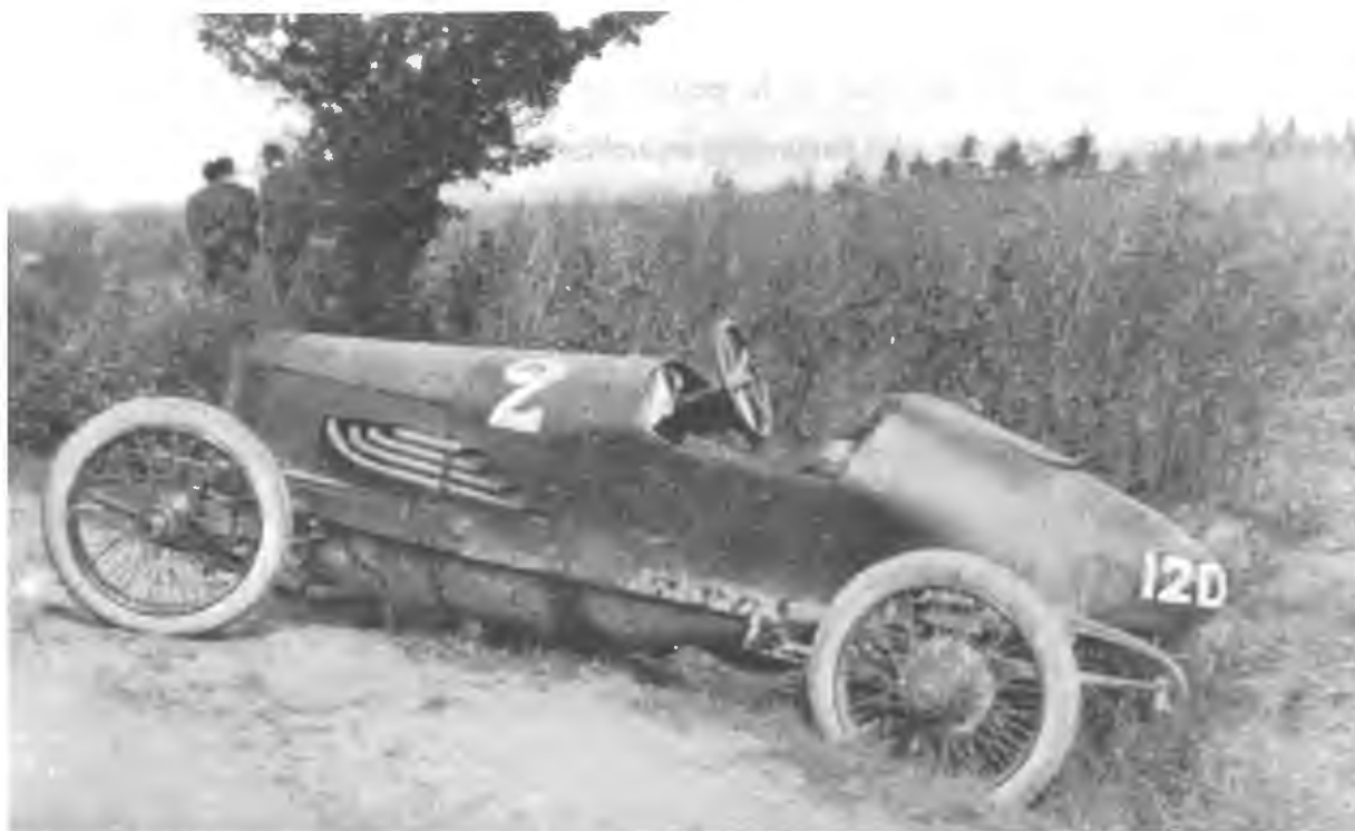
Voiture SPRINGUEL.